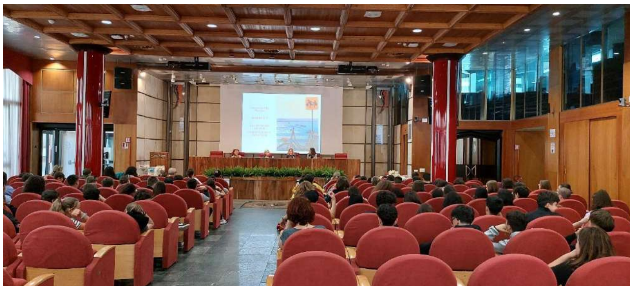
Un momento della premiazione del concorso

A ottobre la Fondazione ha diramato il regolamento relativo all' edizione 2024/2025 del concorso.